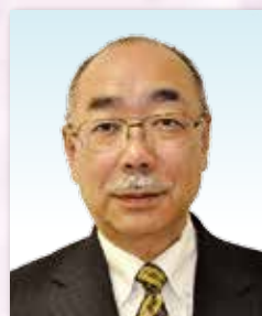
南大和病院 リハビリテーション部 部長