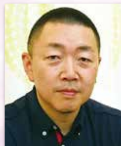
医療法人真正会 コミュニケーション部 部長