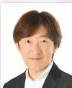
医療法人和香会・博愛会 理事長