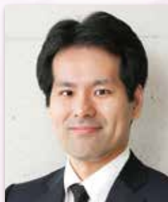
厚生労働省老健局 老人保健課 介護保険データ分析室 室長