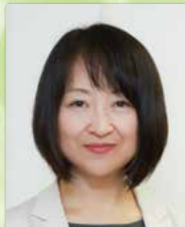
保健・医療・福祉サービス研究会 診療介護報酬指導講師 株式会社リンクアップラボ 代表