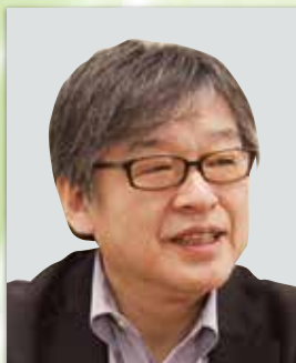
保健・医療・福祉サービス研究会 診療報酬病院経営指導講師 株式会社MM オフィス 代表 関東学院大学大学院 非常勤講師

※午後の「リハビリテーションの将来と病院経営シンポジウム」に参加のお客様でお弁当希望の方は、 申込書欄の「お弁当希望」にチェックを入れ、参加料と弁当代の合計金額をお振り込みください。