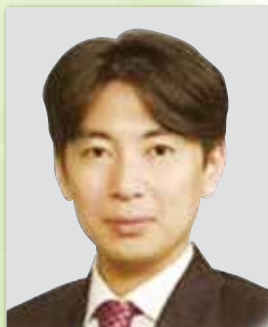
千葉大学医学部附属病院 副院長 病院経営管理学研究センター長