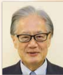
一般社団法人日本医療法人協会 副会長 医療法人博仁会・社会福祉法人博友会 理事長