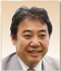
医療法人社団永生会 特別顧問