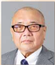
公益社団法人全日本病院協会 会長

参加料 HMS会員(法人・個人・購読・メール) 13,200円(税込) 一般(非会員) ..... 19,800円(税込) ※参加料には、資料・コーヒー代を含みます。