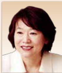
ASK梓診療報酬研究所 所長