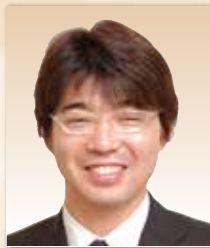
株式会社メディヴァ 取締役 コンサルティング事業部長