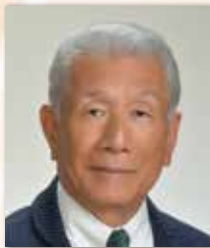
一般社団法人日本慢性期医療協会 会長 医療法人 平成博愛会 博愛記念病院 理事長