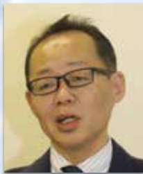
上智大学 総合人間科学部 社会福祉学科 准教授