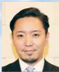
全国人材支援事業協同組合 代表理事