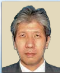
厚生労働省 社会・援護局 福祉基盤課 課長

外国人介護人材雇用促進交流会 6月27日(土) PM6:00~PM8:00 会費6,600円(税込) 全国町村会館 東京都千代田区永田町1丁目11-35 TEL 03-3581-0471