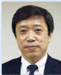
株式会社TSB・ ケア・アカデミー 代表取締役社長