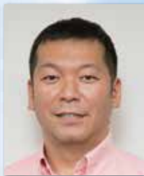
JVMCHR 代表取締役 株式会社青山ケアサポート 代表取締役