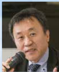
社会医療法人愛仁会本部 統括部長