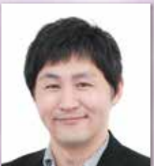
日の出医療福祉グループ エリア責任者