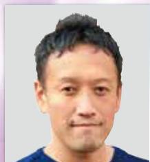
株式会社あおいけあ 代表取締役