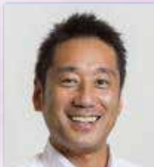
医療法人博仁会 コミュニティケアサービス部 水戸エリア科 科長