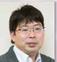
キャオスホールディングス株式会社 経営企画部 専務