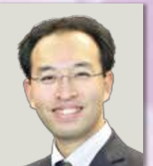
天晴れ介護サービス総合教育研究所株式会社 代表取締役