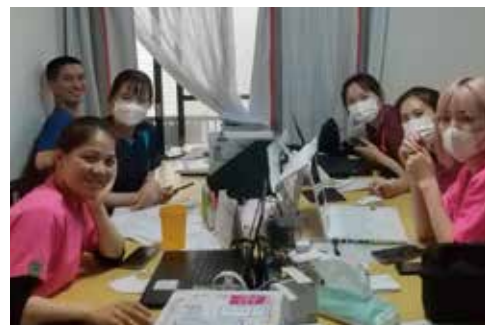
多数活躍するベトナム人介護福祉士