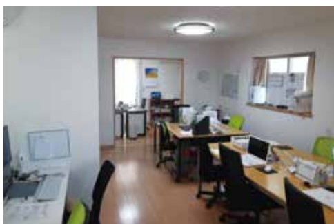
事業所として一戸建てを活用

~マーケティング、事業計画(収支・資金)、備品計画、利用者確保、 職員採用・教育・定着、勤務シフト・記録ソフト・運営の実際を現地で学ぶ~