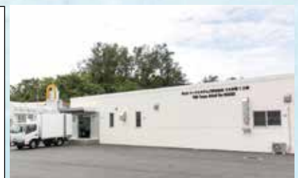
WJUフードシステムズ(株)うるま第一工場の外観