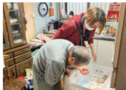
定期巡回・随時対応サービス