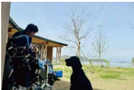
米子市の中海に面した建物