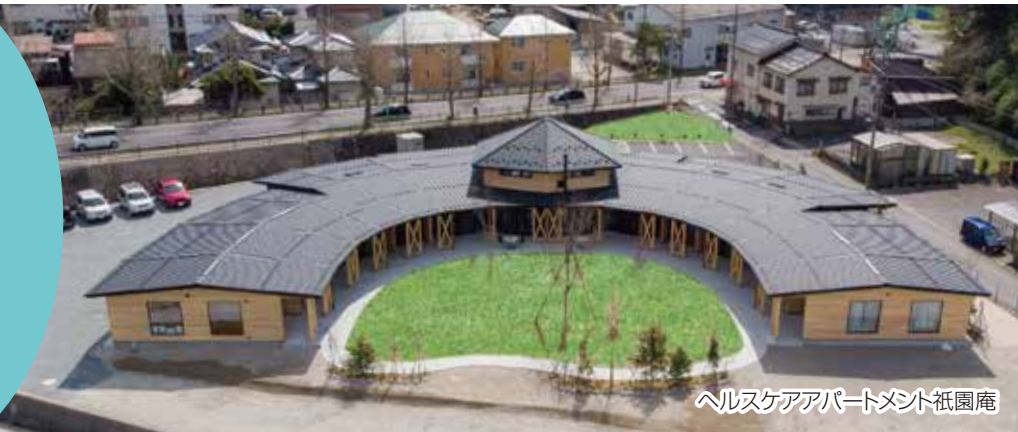
ヘルスケアアパートメント祇園庵