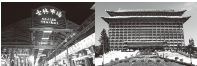
台湾の屋台料理が並ぶ夜市で有名な「士林市場」 建築デザインが美しい北園山ホテル(大飯店)