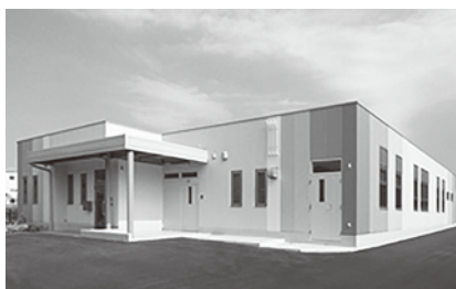
セントラルキッチン デリキッチンにしわき