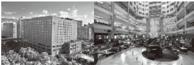
ハワードプラザホテル台北/エバグリーンホテル長榮桂冠酒店(宿泊ホテル)