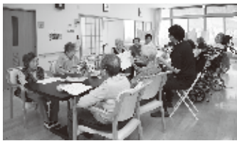
「複合型小規模多機能ほっとの家」のリビング