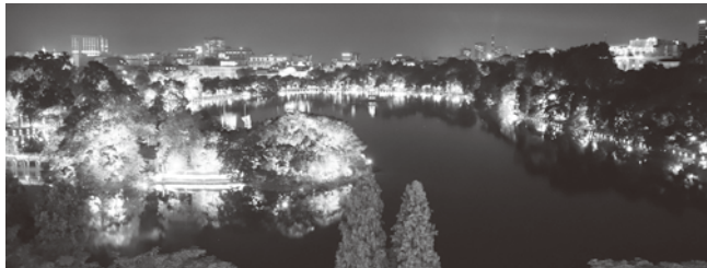
亀の塔で有名な観光地のホアンキエム湖