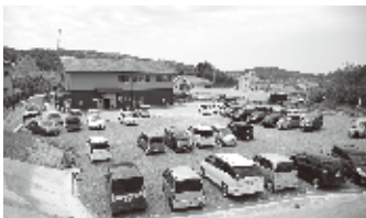
有)ホットケアセンター」外観

参加料 HMS会員 25,650円(税別)(法人・個人会員) 27,075円(税別)(会報誌購読会員) — 一般 28,500円(税別)(資料・コピー代含む)