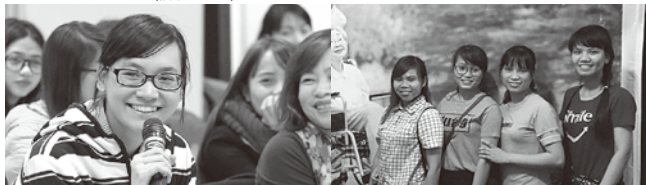
日本の介護福祉士の資格取得をめざすベトナムの若者