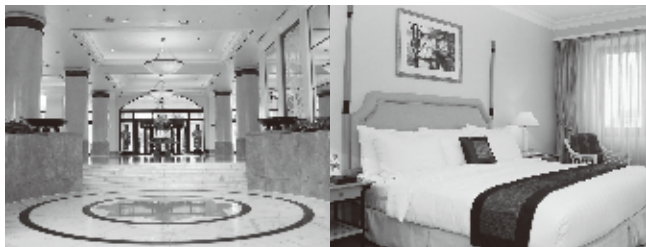
Hanoi Daewoo Hotel (宿泊ホテル)