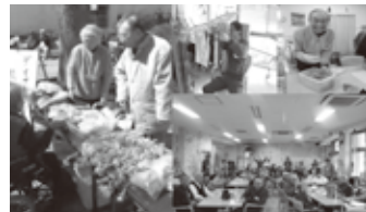
デイサービス藤の台

開催日 令和元年11月7日(木) AM9:30～PM4:30 令和2年3月5日(木) AM9:30～PM4:30 会場 リハビリテーション楓 横浜青葉 定員 20名 神奈川県横浜市青葉区しらとり台57-6 プリムローズM二番館1階 TEL 045(989)3711 参加料 HMS会員 25,650円(税別)(法人・個人会員) 27,075円(税別)(会報誌購読会員) 一般 28,500円(税別)(資料・コーヒー代含む)